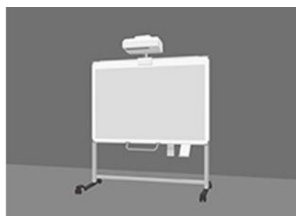
(ボードスタンド設置)