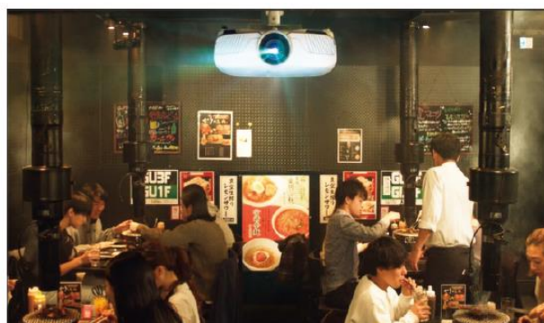
油や煙の多い飲食店

※ご家庭で月に1回程度、キッチン、ダイニング、リビングで焼き肉などをした場合でも、プロジェクター設置後に数年の歳月をかけて落下に至るおそれがありますので、専用窓口までご連絡いただけますようお願い申し上げます。