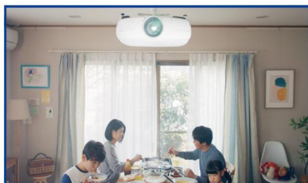
ご家庭のキッチン・ダイニング・リビング