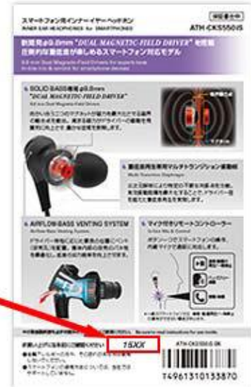
▲ ATH-CKS550iS パッケージ裏面