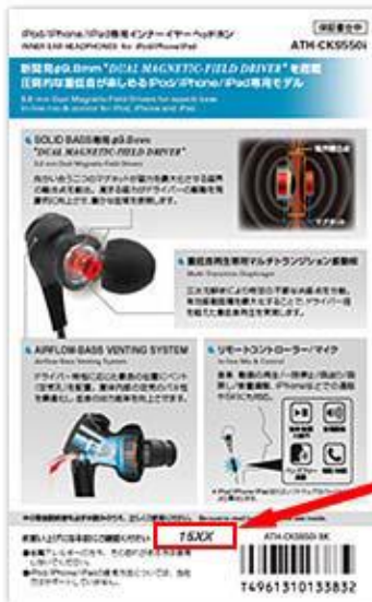
▲ ATH-CKS550i パッケージ裏面