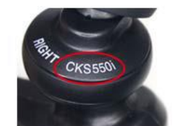
製品本体に「ATH-CKS550i」の印刷

スマートフォン用インナーイヤーヘッドホン 「ATH-CKS550iS BK/BL/RD/WH」