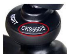
製品本体に「ATH-CKS550iS」の印刷