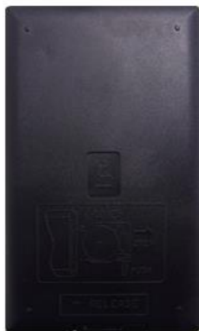
(写真-4)未改善リモコン(背面)