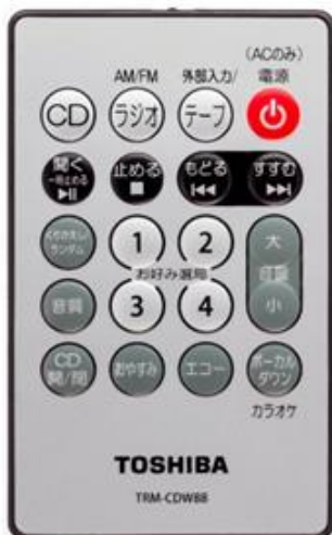
(写真-3)リモコンの前面