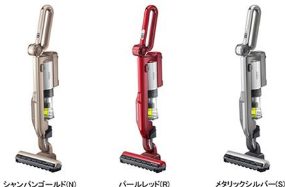
シャンパンゴールド(N)