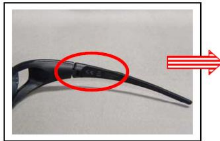
図2. 製品形名は、右フレーム部内側に記載してあります