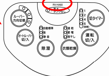
操作パネル部拡大