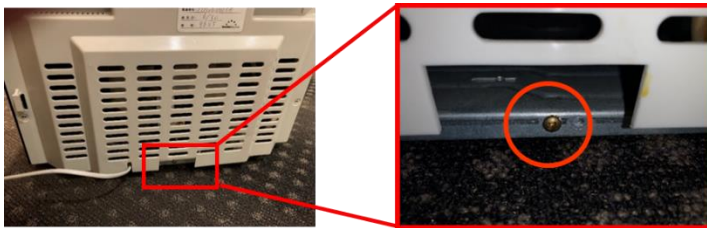
ワインセラー背面下部

※ワインセラーの背面を確認するためにワインセラーを移動される場合は、安全確保のためワインボトルなどの収納物を取り出して庫内を空にしてから移動させてください。