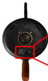
ケトル本体底面裏