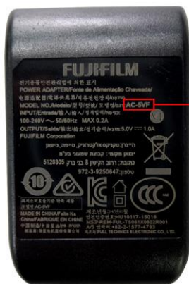
【ACパワーアダプター表面】