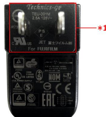
【ACパワーアダプター裏面】 *1プラグ部