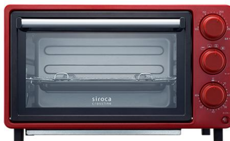
写真は「SCO-502」(レッド色)です。