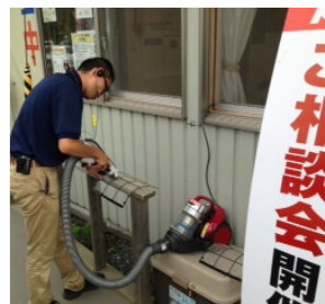
エアコンフィルター清掃